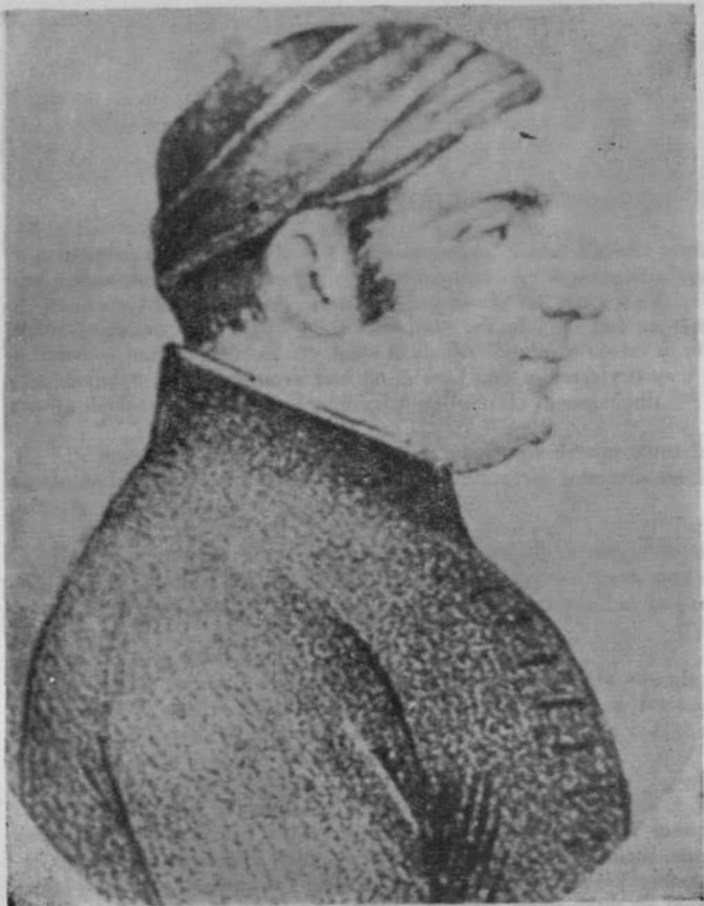
José María Morelos y Pavón.