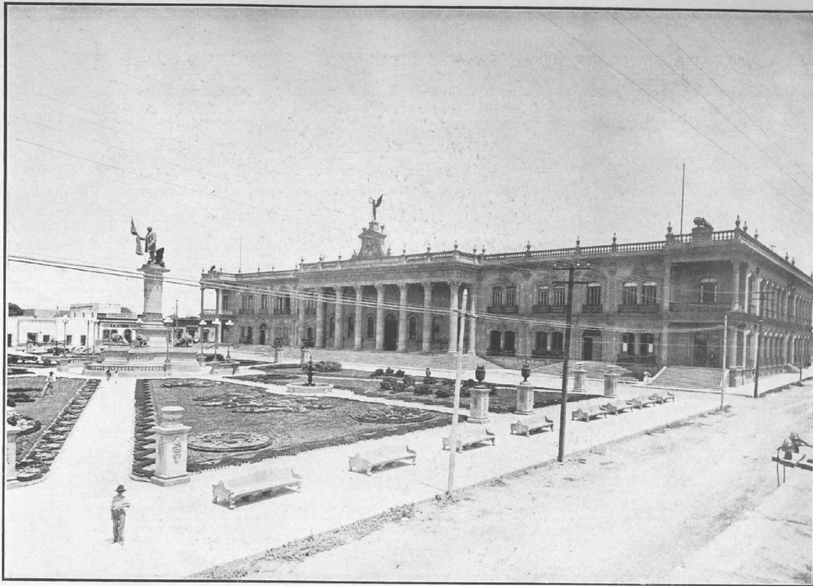
PALACIO DE GOBIERNO. MONTERREY, NUEVO LEÓN.