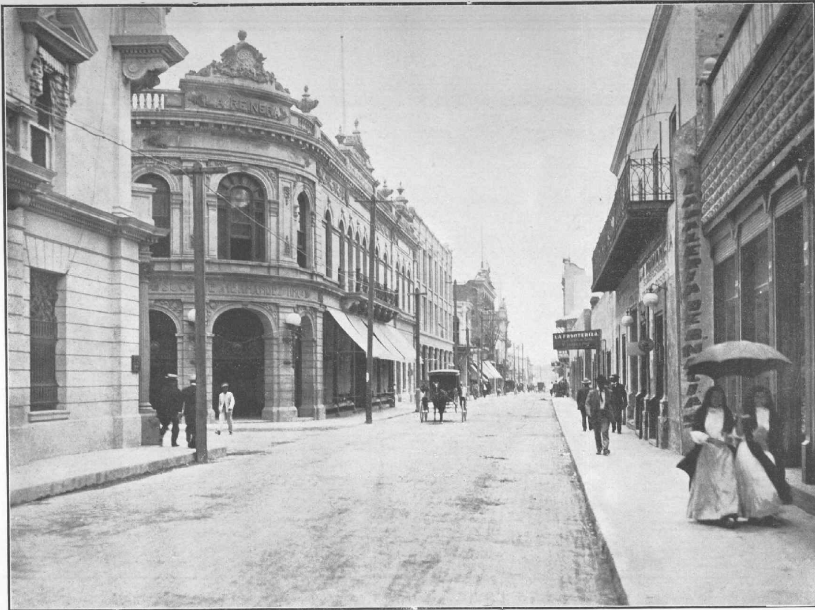
CALLE DE MORELOS. MONTERREY, NUEVO LEÓN.