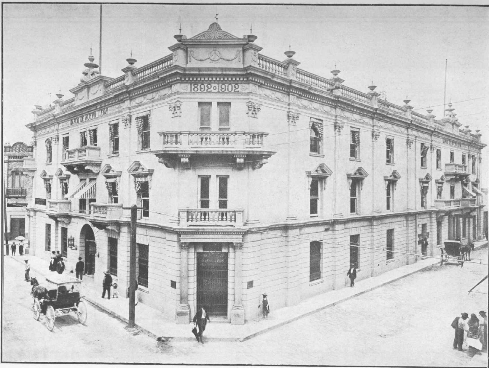
BANCO DE NUEVO LEÓN. MONTERREY, N. L.