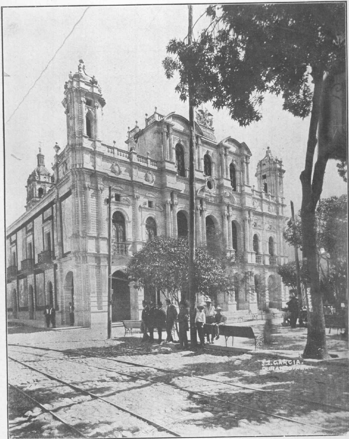
PALACIO MUNICIPAL. DURANGO.