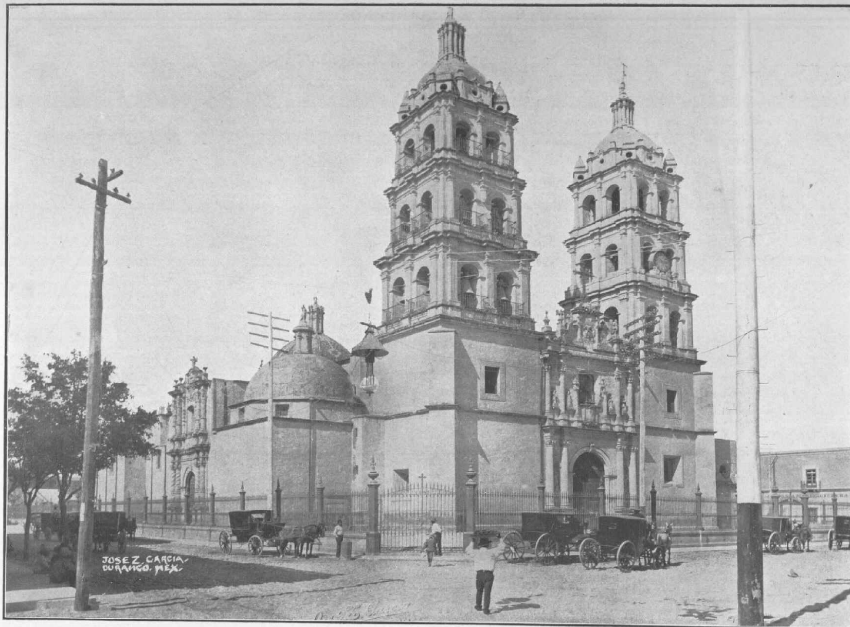
CATEDRAL DE DURANGO.