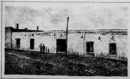
Casa que habitó el Presidente D. Benito Juárez en la Villa de Paso del Norte.

Das veces se vio obligado á refugiarse el jefe del partido republicano en aquella lejana población fronteriza, supliendo la bandera nacional, con la que se opuso á la intervencion y al Imperio de Maximiliano de Hapsburgo.